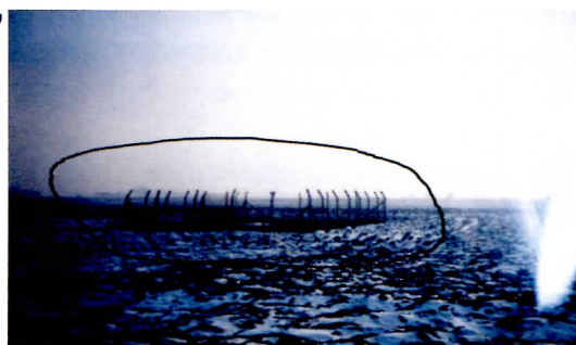
ВОДОВОД У ПРЊАВОРУ