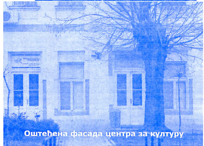
Оштећена фасада центра за културу