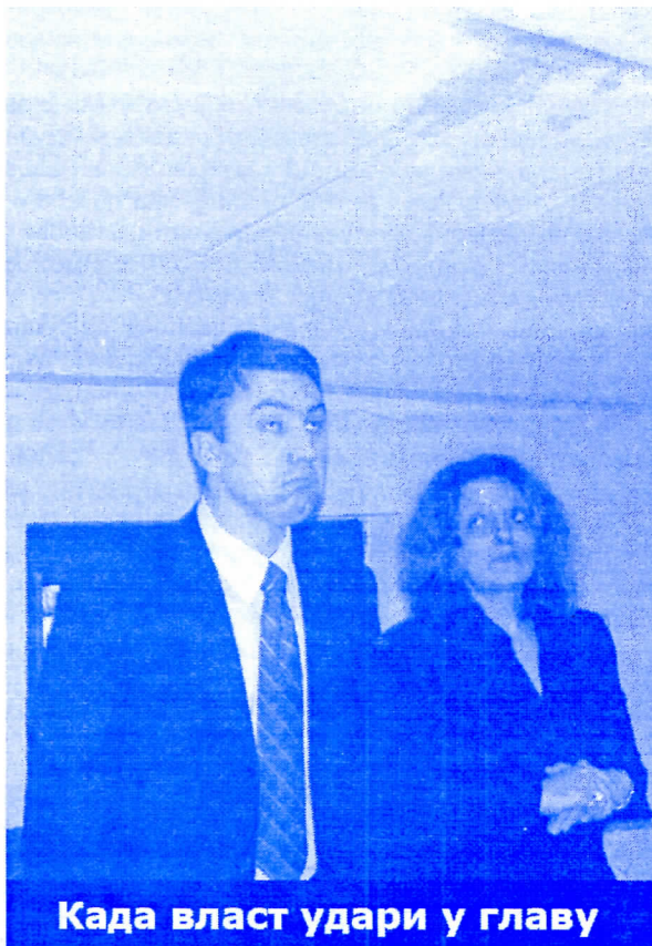
Када власт удари у главу