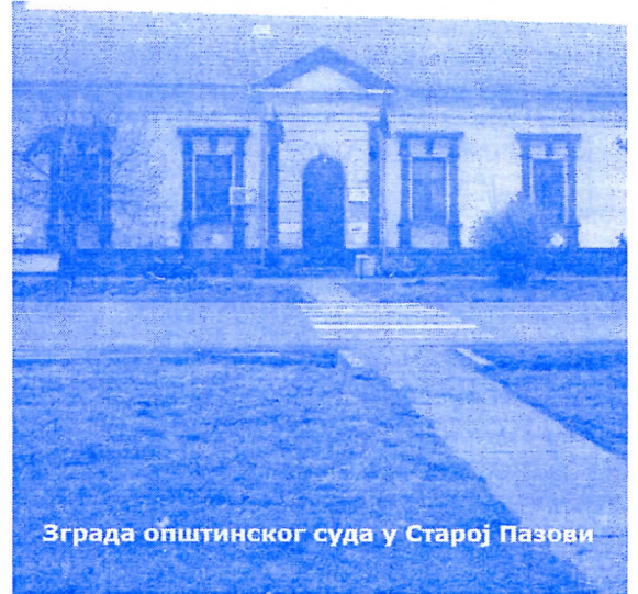
Зграда општинског суда у Старој Пазови