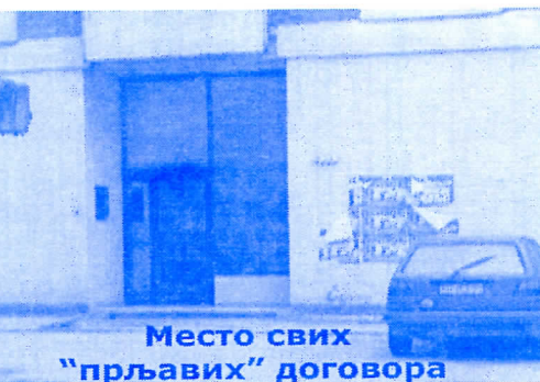
Место свих “прљавих” договора