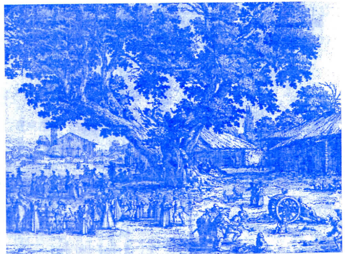
Уметничко дело даје животи елан

Порекло уметности налази се у људском нагону да се изразе мисли и осећања кроз стварање и забављање. Уметничко дело даје животи елан, пружа двоструко задовољство, како ономе ко га ствара, тако и ономе ко га посматра. Зато ће уметничке галерије, као установе у којима се прикупљају, излажу и научно обрађују уметничка дела, имати пуну материјалну и