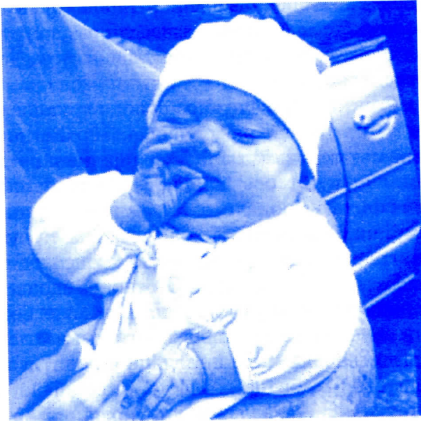
Бајба и сека, суйер! Али хоћу још.

делом из буџетских средстава, делом путем спонзорства и донација, традиционалним аукцијама и другим манифестацијама, обезбеђивати средства за симболично обележавање захвалности поводом рођења и поклон-пакетима