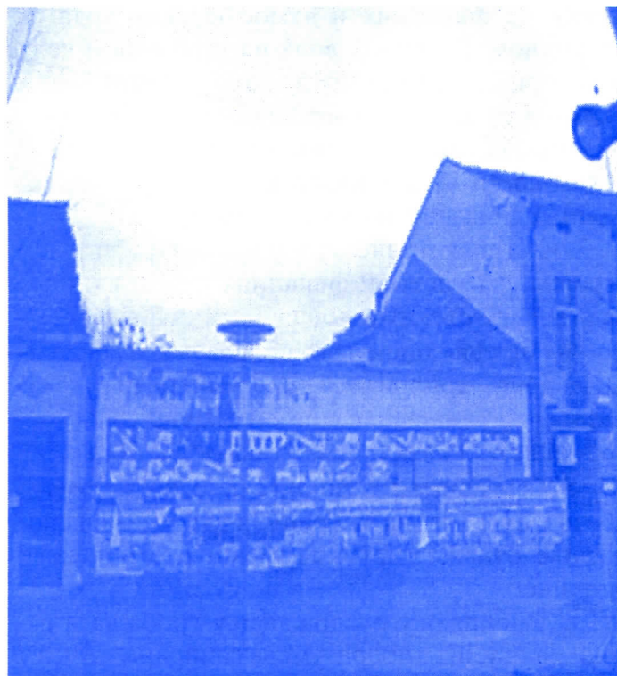
Изградње се, али њолако, док се заборави ко и како

- уређењу централне градске зоне у погледу слободних површина и комуникација,