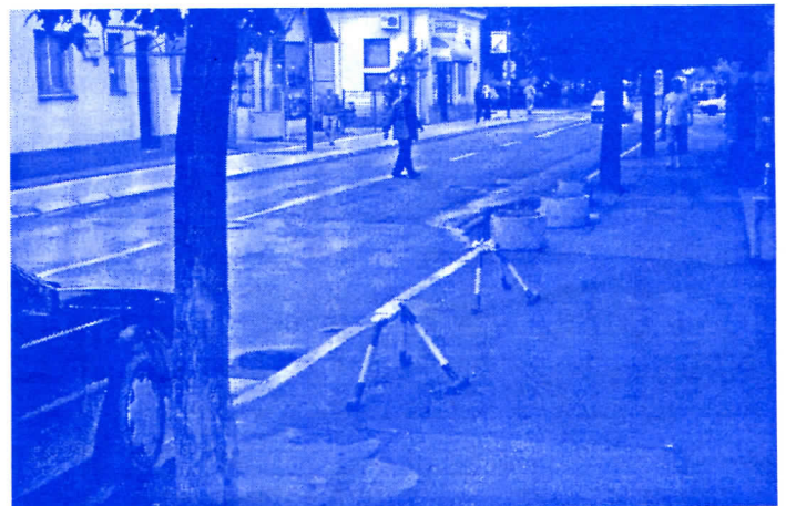
Врљике - усјех самозване демократске власти

Ради обезбеђења максималне проточности и безбедности саобраћаја на територији оп-