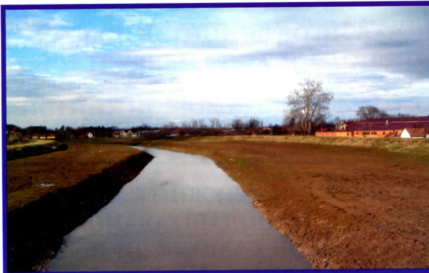
Радови на делу Кубршнице

Да би Месна заједница Стара чаршија, као једна од најугроженијих градским Месних заједница, остварила пројекат заштитне зграда и зрађана од стоогодишњих вода , морала је да прође трновити пут убеђујући представнике прошле и садашње власти да је овај пројекат од елементарног интереса за живот града. На делу Месне заједнице Стара чаршија, да подсетимо, налази се извор живота целог града. Пре свега изворишта и фабрика за прераду пијаће воде, као и трафостаница Електро-исток, који снабдева целу Општину електричном енергијом. Поред тога, на овом делу територије налази се и институција од светског значаја Институт за поврћарство , који је једини у земљи и снабдева семеном све пољопривредне произвођаче не само у земљи, већ на целом Балкану, а и шире. Највећи проблем преко хиљаду становника Месне заједнице између токова река Кубршнице и Јасенице је на који начин да за-