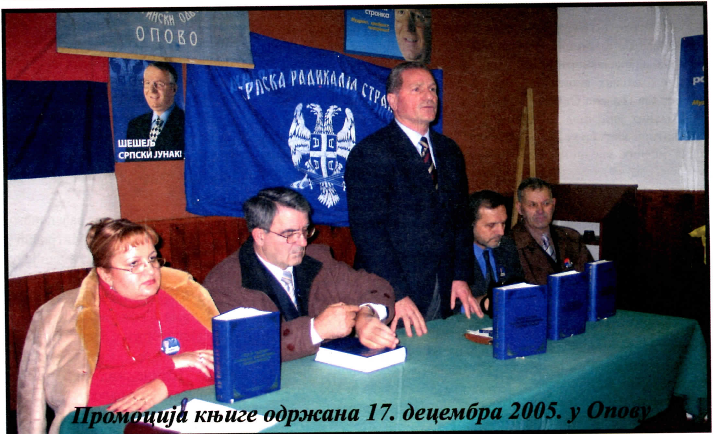
Промоција књиге одржана 17. децембра 2005. у Опову