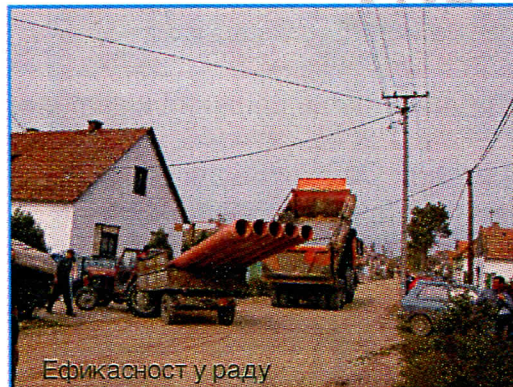
Ефикасност у раду

Странке, за само годину дана, грађани ове улице су добили асвалтирану улицу. Да ли увиђате зашто је опозиција против нас и жели превремене изборе? Уплашили се да ако овако наставимо, а наша је гаранција да хоћемо и радићемо да побољшамо квалитет живота грађанима у целој општини, њих на политичкој сцени више неће бити, зато што ће те ви сами увидети да је Српска Радикална Странка, једина странка, која ради у интересу грађана својим делима, а не празним причама.