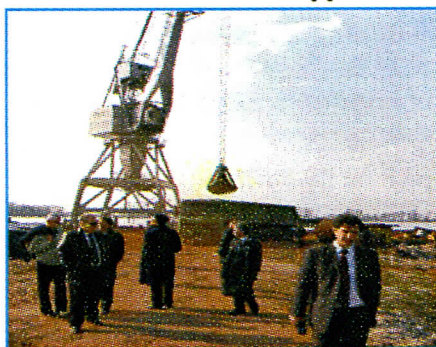
Истовар роба, биће и код нас

Зато ће 2006. година бити прекретница за развој наше општине.