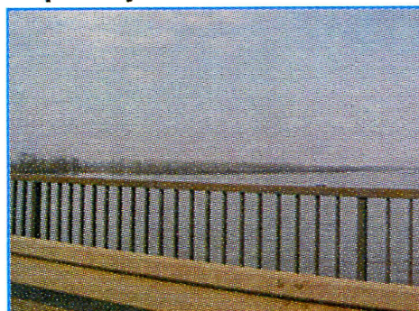
Поглед са моста на терен за Луку