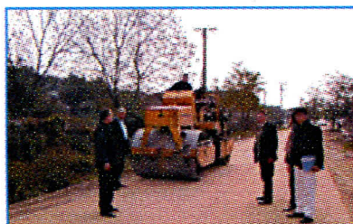
Извођење радова у Пролетерској

Ковин мора да знају како се понашају одборници којима су они дали поверење гласајући за њих. Да ли је могуће да члан Управног Одбора Комуналца (ПСС) гласа за да се конкурише код Фонда за развој и обезбеде средства за куповину плаца, а председник његове партије/покрета (ПСС), као члан Управног Одбора Фонда за Развој општине Ковин, буде уздржан код одлучивања. Чланови Управног Одбора Фонда за Развој припадници Српске Радикалне Странке су гласали за, што је и било нормално пошто је Фонд у свом програму већ имао одлуку о обезбеђењу ових средстава на кредитној бази. ЈП Ковински Комуналац је испоштовао све критеријуме Конкурса и на време доставио сву потребну документацију Фонду. Из овога се види да су поједини чланови Управног Одбора Фонда прекорачили своја овлашћења, односно нису радили по програму који су они донели. Српска Радикална Странка и даље ће радити у интересу грађана општине.