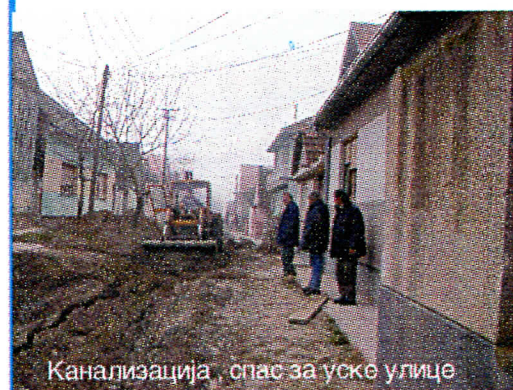
Канализација - спас за уске улице