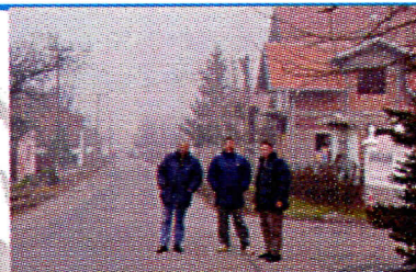
Данашњи изглед Пролетерске

Одборници Српске Радикалне Странке обишли су Пролетерску улицу за време радова како би се уверили да радови теку по предвиђеном плану. Грађани, да ли сте се питали колико година сте газили блато и воду у овој улици? Учешћем у општинској власти Српске Радикалне