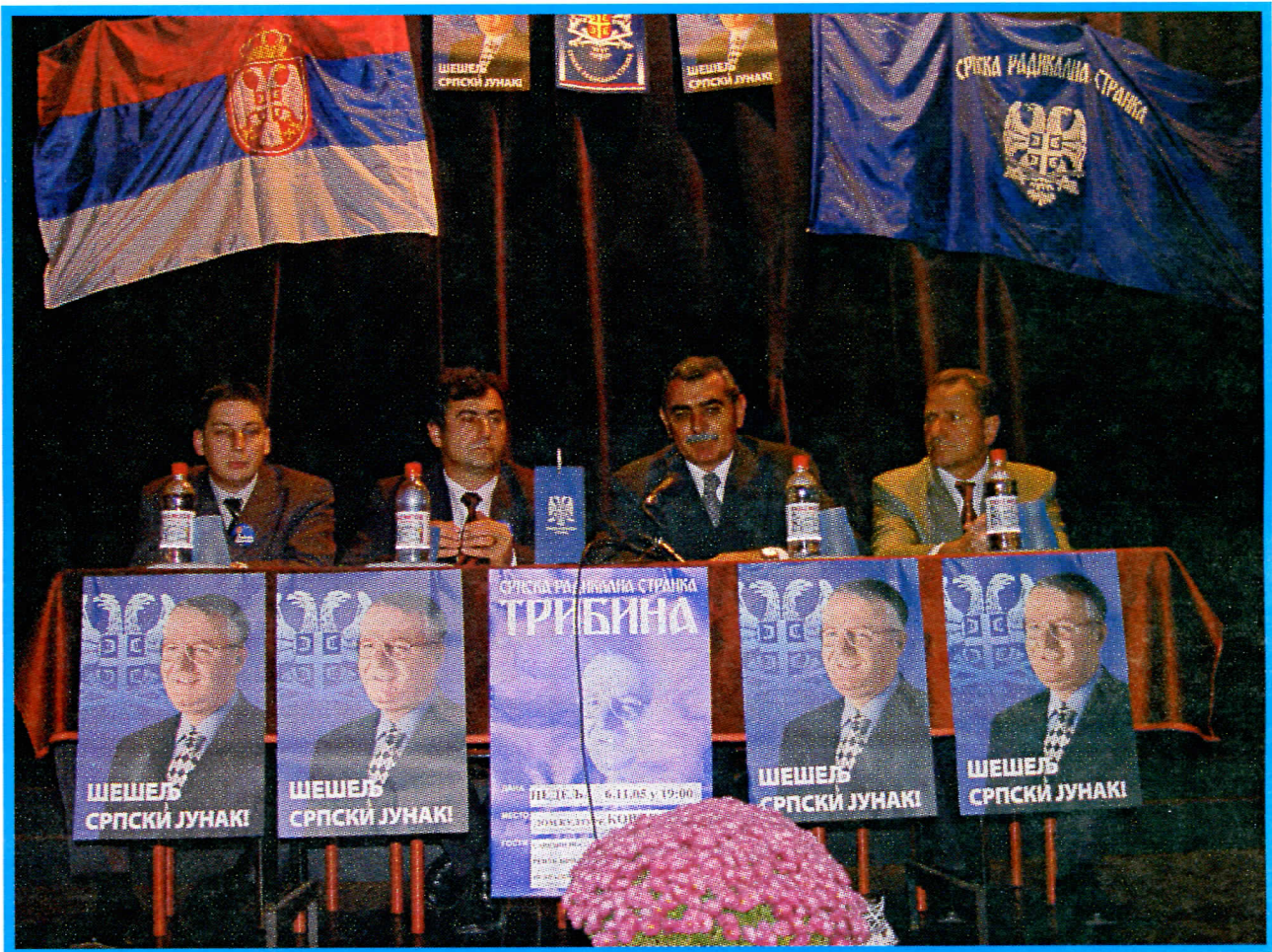
ТРИБИНА СРПСКЕ РАДИКАЛНЕ СТРАНКЕ У ДОМУ КУЛТУРЕ У КОВИНУ

ОПШТИНСКИ ОДБОР КОВИН ЈАНУАР 2006. ГОДИНА