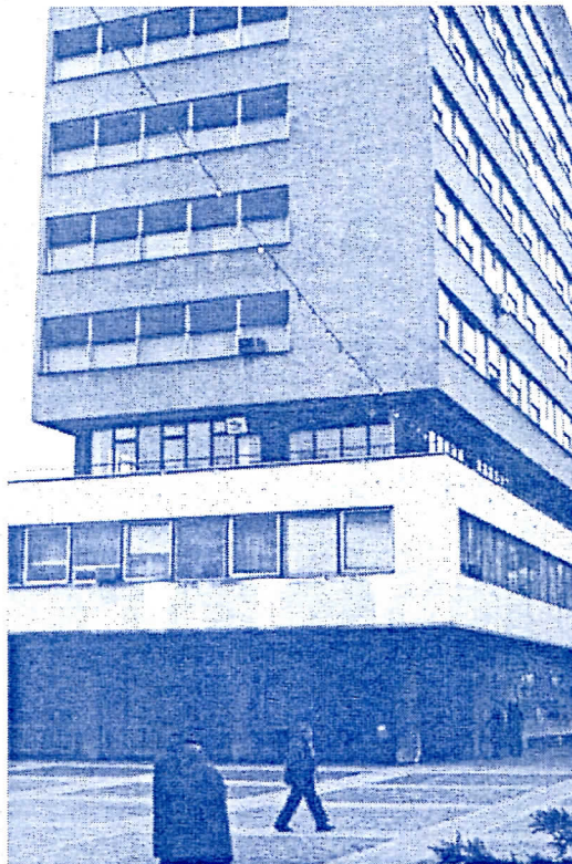
Панчево град без капиталних инвестиција