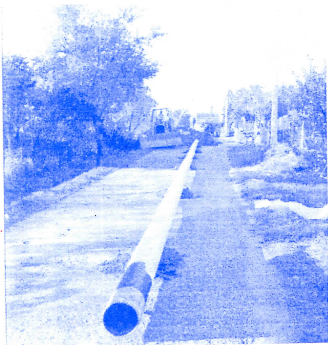
Радови на гaфикационој мрежи

ПОШТОВАНО ГРАЂАНИ, БУДИТЕ УВЕРЕНИ ДА ЋЕМО, УКОЛИКО СЕ НЕ ИЗБОРИМО ЗА ОВЕ ЦИЉЕВЕ У НАРОДНОМ ПЕРИОДУ, ПРЕИСПИТАТИ НАШЕ ДАЉЕ УЧЕШЋЕ У ФОРМИРАНОЈ ПРОГРАМСКОЈ КОАЛИЦИЈИ, ИЛИ ЋЕМО БИТИ ЈОШ БОЉИ ИЛИ СРПСКИ РАДИКАЛИ НЕЋЕ УЧЕСТВОВАТИ У ОПШТИНСКОЈ ВЛАСТИ