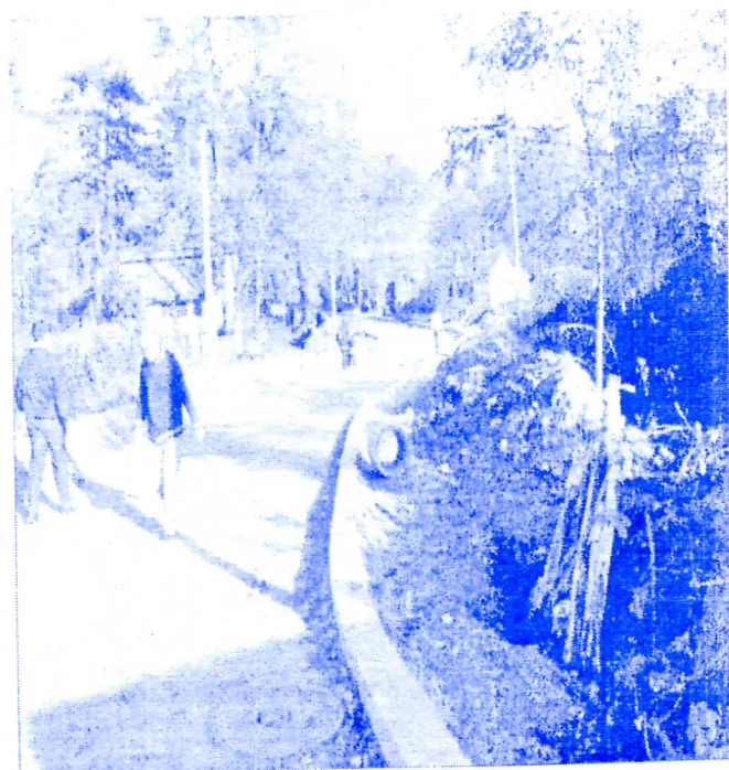
Радови на изградњи улице у Лићови