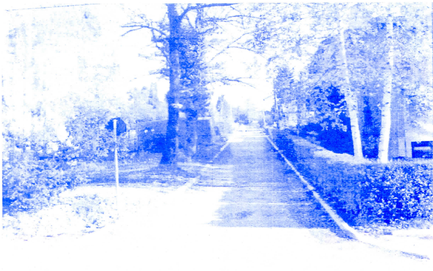
Једна од завршених улица у Врњачкој Бањи

* Релативно скромно издвајање у овој буџетској години за омладину и спортске колективе.