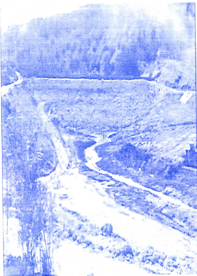
Радови на акумулацији "Селиште"

Обећали смо бољу и ефикаснију власт, а на Вама је да оцените дали је она таква.