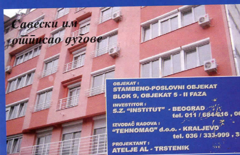
Савески им поштинско дугове

ОБЈЕКАТ : СТАМБЕНО-ПОСЛОВНИ ОБЈЕКАТ БЛОК 9, ОБЈЕКАТ 5 - II ФАЗА ИНВЕСТИТОР : S.Z. "INSTITUT" - БЕОГРАД tel. 011 / 694-616 , 063 / 219 ИЗВОЂАЧ РАДОВА : "ТЕННОМАГ" д.о.о. - КРАЉЕВО tel. 036 / 333-999 , 337-322 ПРОЈЕКАНТ : ATELJE AL - ТРСТЕНИК