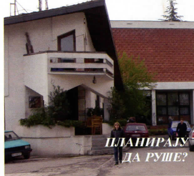
Босови Савског венца безецовали локације

Да је општина решена у свом науму да се домогне милионских провизија, рушењем ових објекта сведочи и најновија одлука општинских челника о издвајању средстава у износу од 2.5 милиона динара за трошкове израде незаконитог Урбанистичког плана блока 20 и 1.