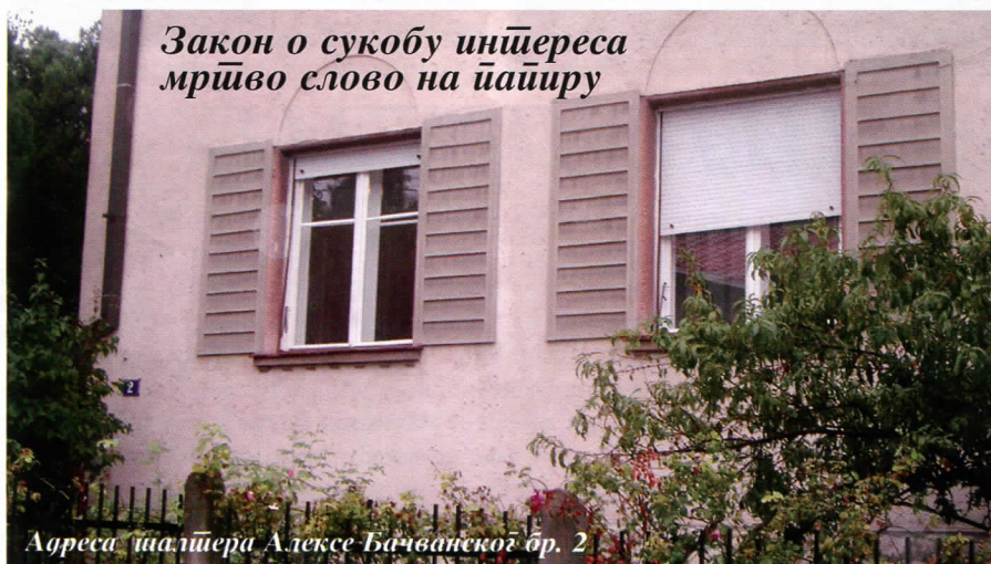
Адреса шалтера Алексе Бачванског бр. 2