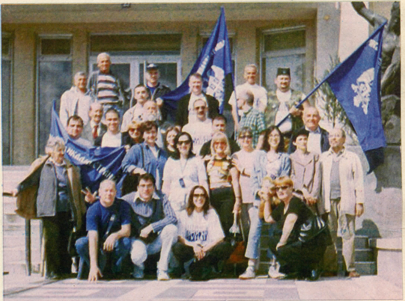
Општински одбор СРС Вождовац

Што се нас тиче, ми смо свој посао обавили на одговарајући начин, заступајући интересе грађана наше општине, а чије интересе у свему наведеном заступа општинско руководство - то ће видети сами грађани.