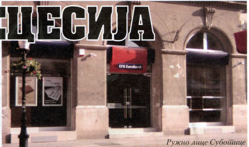
Ружно лице Суботице

Српски радикали сматрају да надлежна инспекција у општини под хитно мора да изда налог за рушење радова које је на спољној фасади извела ЕФГ банка. Али такође знају да машта може свашта, односно да пара врти где бургија неће.