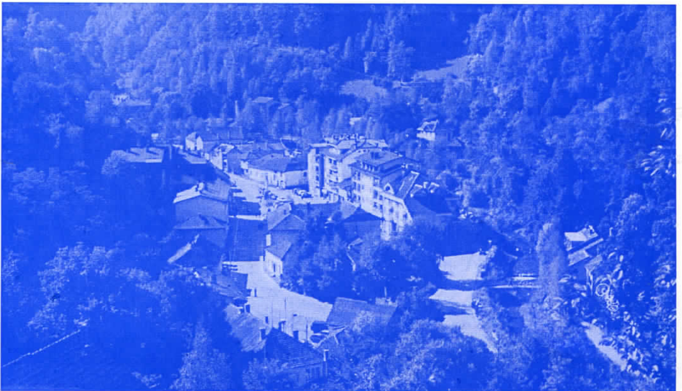
Ако се настјави оваква владавина, биће ово у најскорије време сјананишије духова

Већ је свима јасно да је само српским радикалима једнако стало до свих општина у Србији, што су и доказали многобројним посетама Црној Трави од стране челних људи Странке, а јасно је да је то једина снага која има, поштује и у потпуности спроводи страначки Програм, што је најбитнији предуслов за доследност у политичком деловању.