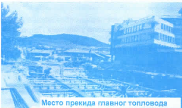
Место прекида главног топловода

ЈКП Градска топлана се налази у изузетно тешкој финансијској ситуацији. Рачуни предузећа су блокирани од стране НИС-Југопетрола од 28.07.2005. године на износ