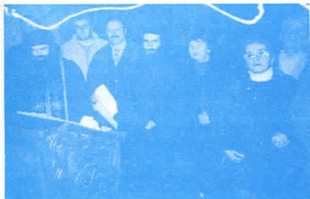
Свечана заклетва одборника СРС ОО Н.Пазар у манастиру Сопотани