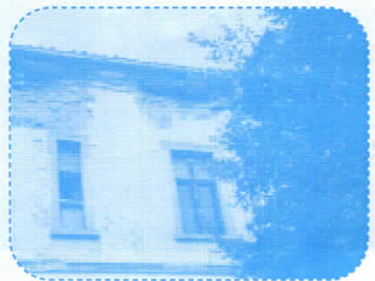
Зграда у којој је смештен Историјски архив "Рас"

Пројекат санације кровне конструкције зграде је одрађен и средства у износу од 2.185.000,00 динара су обезбеђена: 1/4 од СО Нови Пазар, а 3/4 од ресорног министарства. За наредну годину у плану је санација целе зграде Старог суда - архив, највероватније неком врстом донације уз учешће надлежног министарства и општина Нови Пазар, Сјеница и Тутин. Преузета је грађа из "Искре" а ускоро ће и из Општинског суда.