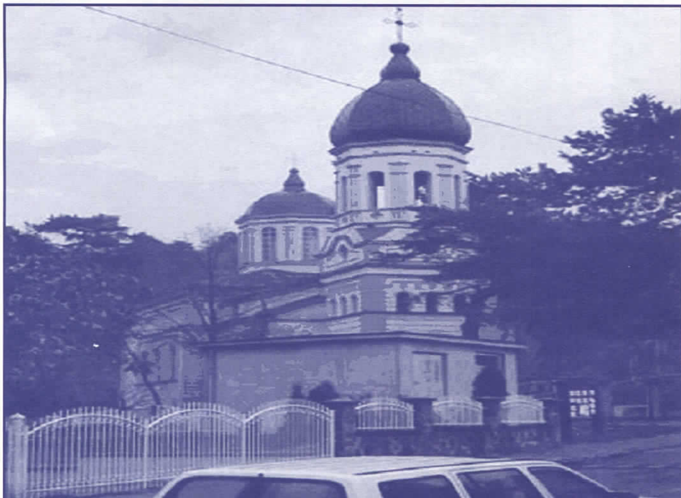
ПРАВОСЛАВНА ЦРКВА У ДИМИРТОВГРАДУ

Азбестне водоводне цеви које, познато је, изазивају карценогена обољења и које се што пре морају заменити новим цевима.