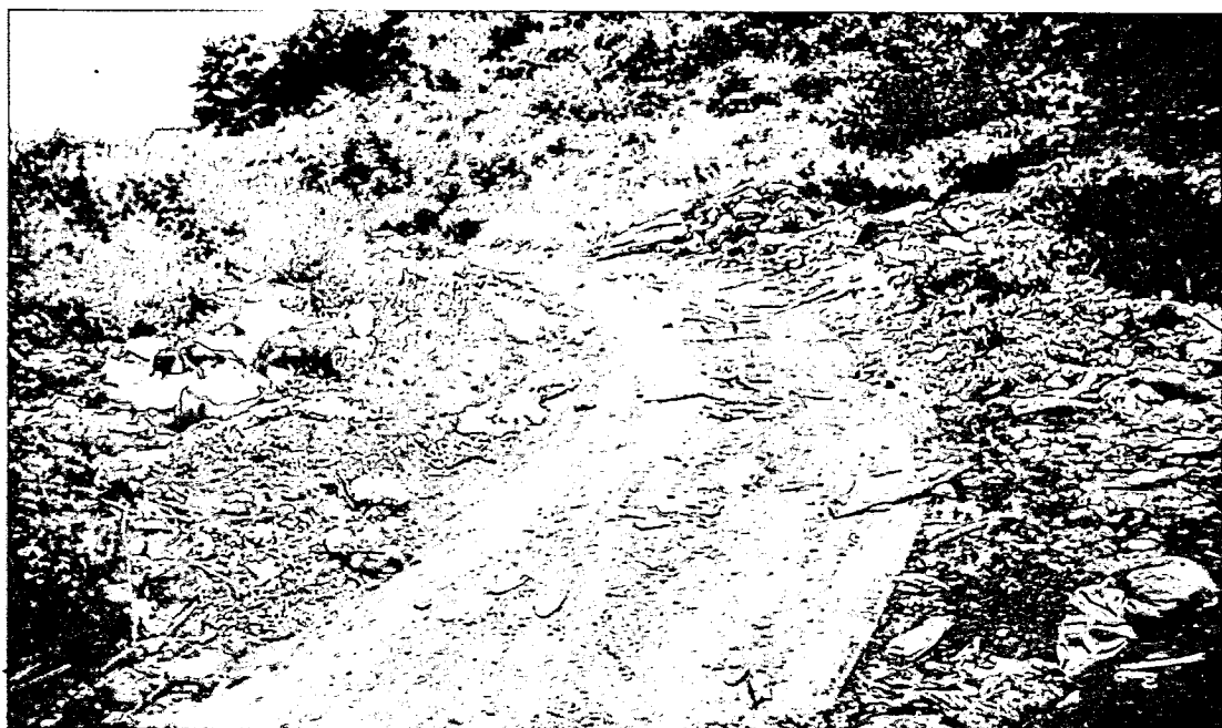
изглед улице Првомајске