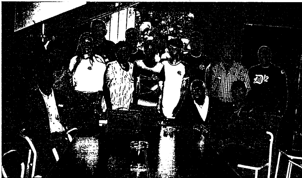
чланови Месног одбора Српске радикалне странке Лешт ар

Програм Српске радикалне странке локалну самоуправу третира као сервис грађана, да грађанин буде задовољан, да буде поштован када се појави у Општини, да за што краће време добије потврду/уверење, да не стрепе од носиоца функција, да општинска управа ради стручно и професионално.