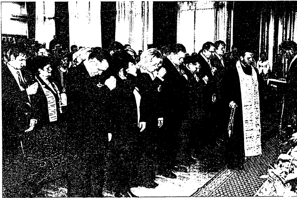
чланови Месног одбора Српске радикалне странке Лешт ар на Годишњој скупштини