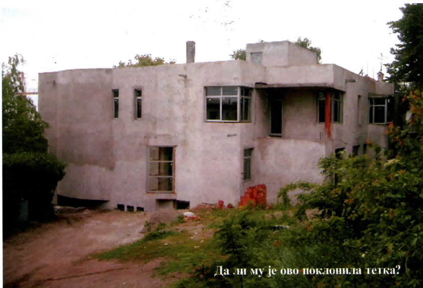
Да ли му је ово поклонила тетка?