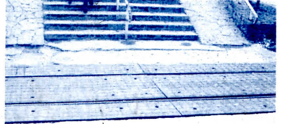
Пружни прелаз у центру

• Постављање арматурне мреже на пружном прелазу у центру града, која би спречила повређивање радника нарочито током зиме. Иако није урађено онако како је договорено тј постављање бродског ребрастог лима, боље је и овако него никако.