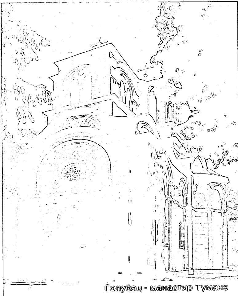
Голубац - манастир Тумане