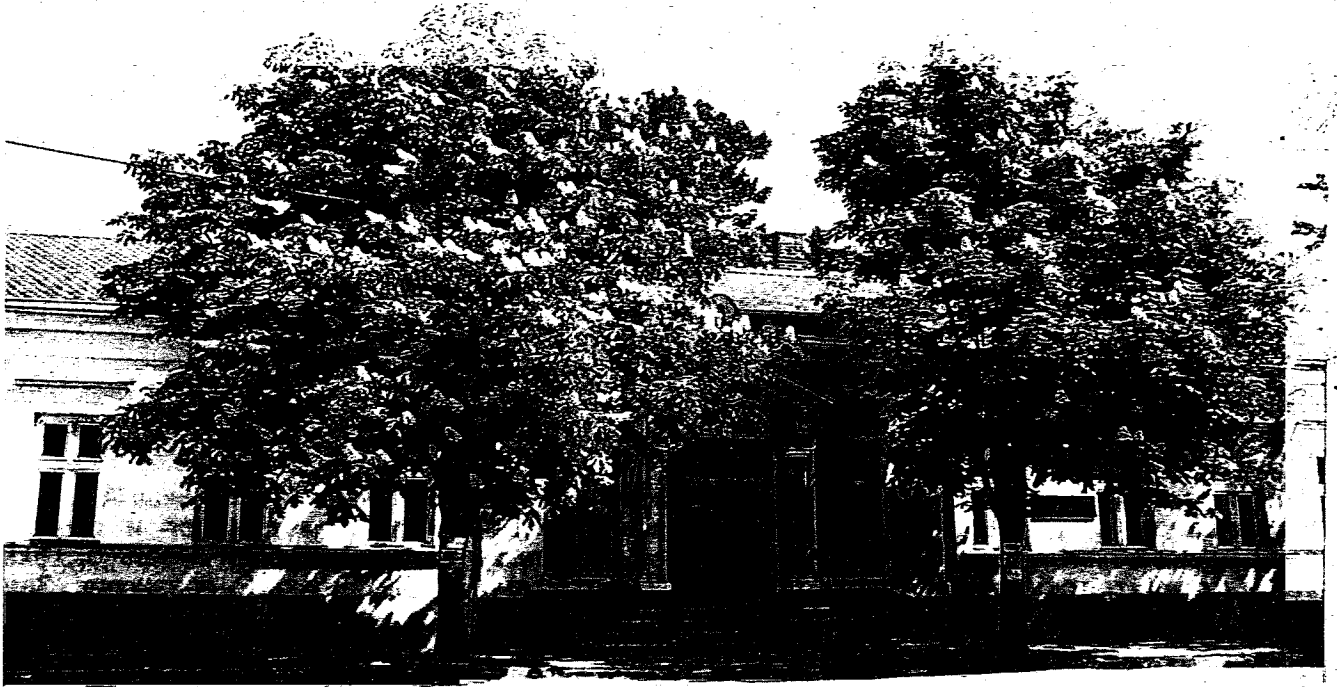
Зграда Општине Жагубица

Све активности које преузима првенствено Општински одбор Српске Радикалне странке као и Месни одбори Српске Радикалне странке усмерене су на постизању што веће популарности саме Српске Радикалне странке као и непосредно на побољшање стандарда грађана и олакшање њихових животних потреба.