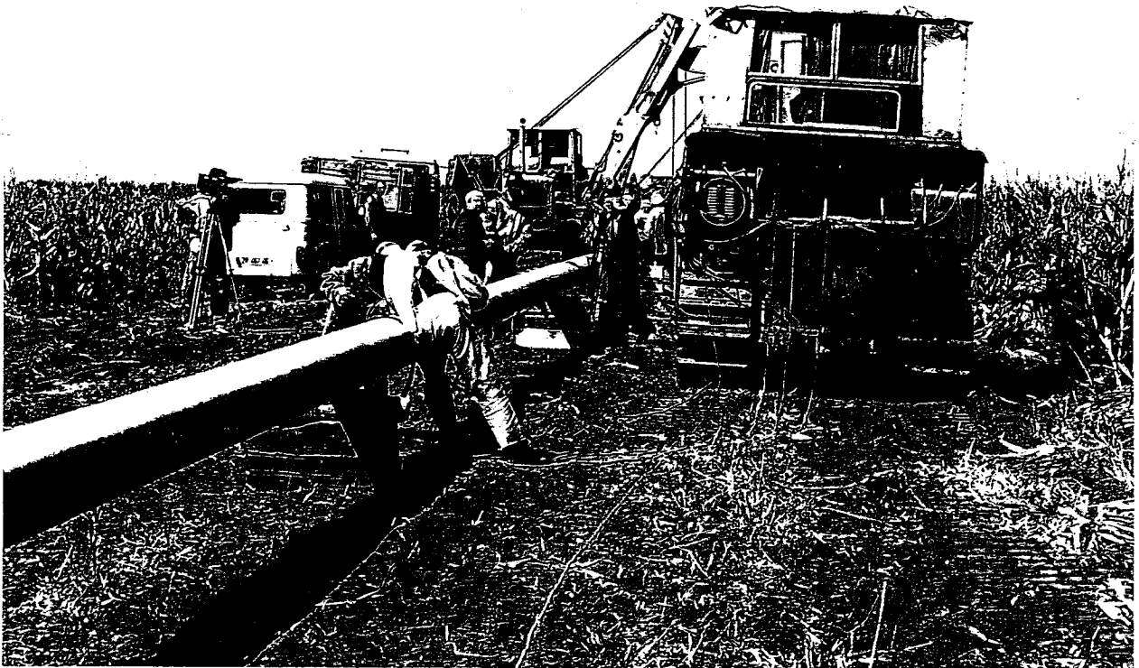
Почетак радова на гасификацији наше Општине

Свака наша идеја која угледа светлост дана биће огледало које треба да осликава ову нашу напаћену мајку Србију и разлог грађанима и бирачима да нас подрже на свим предстојећим изборима, како би најзад Србијом владали они које је воле више него ико, они који је неће издати зарад било чијег интереса.