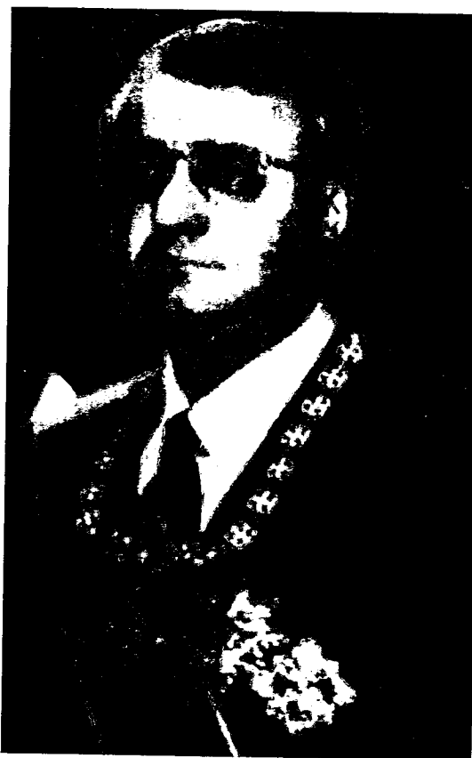
др. Војислав Шешељ

Осим овога, налазимо се на најбољем путу да Општина Апатин добије донације и кредит Светске Банке, којим би се отворио простор за доградњу фабрике воде, замене 46 км азбестно-цементних водоводних цеви, за завршетак фекалне канализације и градског пречишћивача воде.