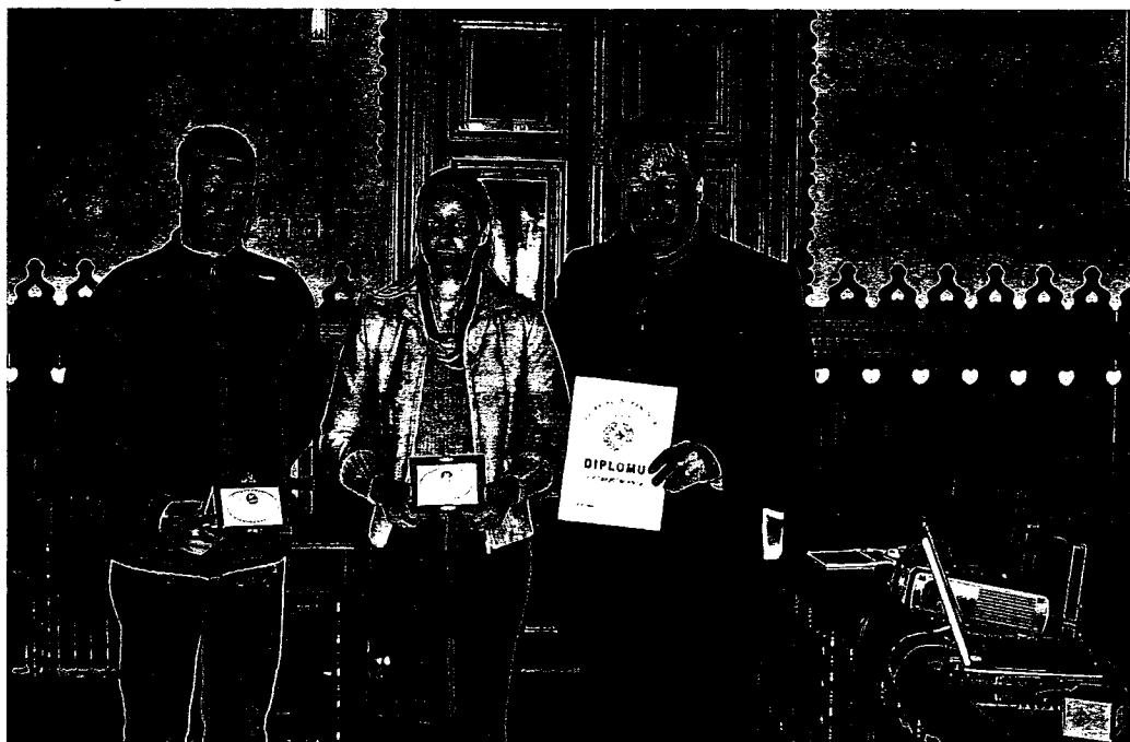
Додела диплома и стипендија најбољим спортистима и репрезентативцима.

Свакако је вредно помена и читав низ буџетских ставки које су превасходно социјалног карактера. Ученицима који су тешког материјалног стања обезбеђена су средства којима се рефундира превоз жељезницом од 100%, што до сада није био случај. Студентима на територији наше Општине који су деца жртава рата и студентима који имају запажене успехе, такође је додељено 106 стипендија. Запослено је 32 приправника – волонтера са вишим и високим образовање на терет општинског буџета.