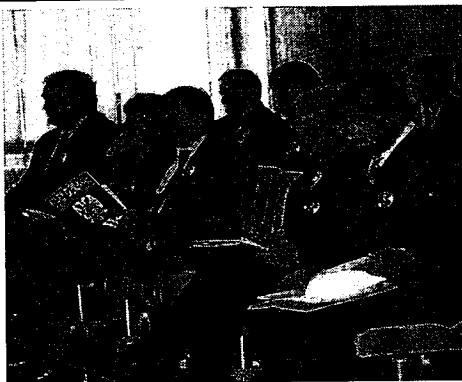
Одборничка група Српских радикала

Захтевамо да се од владе тражи хитно спровођење истраге и кажњавање одговорних лица која су незаконито дозволила вршење геолошких истраживања на територији наше општине. У расправи о извештају о раду дирекције за изградњу у 2004. години, захтевали смо да се прецизно дефинишу утрошена средства, да би се видело дали су наменски трошена. Такође смо поставили питање зашто није постојао надзор над изведеним радовима, јер су многи послови урађени лоше без икакве контроле, а паре из буџета су потрошене. Због многих нејасноћа у извештају дирекције чак ни одборници скупштинске већине нису гласали за извештај тако да он није ни усвојен. Захтеваћемо да директор, управни и надзорни одбор поднесу оставке, а да се пословање дирекције за изградњу испита и ако буде неправилности одговорни казне. Председник општине такође сноси одговорност јер је он предлагач извештаја који скупштина није усвојила. Наш амандман на статут установе Велики парк, да директор установе мора бити лице са завршеном високом или вишом стручном спремом, одборници скупштинске већине зарад задовољења страначких интереса, нису усвојили. Пошто статут није предвидео која је стручна спрема потребна за директора, по њима то може бити и лице без основне школе. Медији објављују само да је одржана седница скупштине и одлуке које су донете, тако да се ствара утисак да су одборници једногласно донели све одлуке. Нико не објављује да се опозиција жестоко бори и критикује одлуке које су лоше и штетне за интересе грађана.