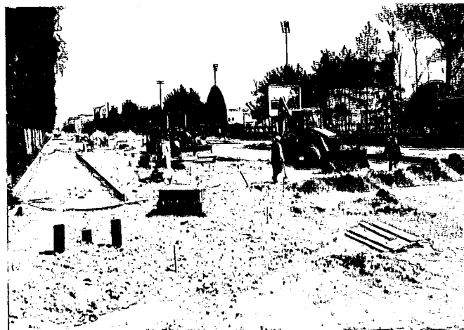
Почетак радова у улици Новосадског сајма, Нови Сад