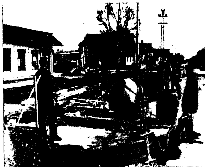
Изградња јавног осветљења центра Ковиља