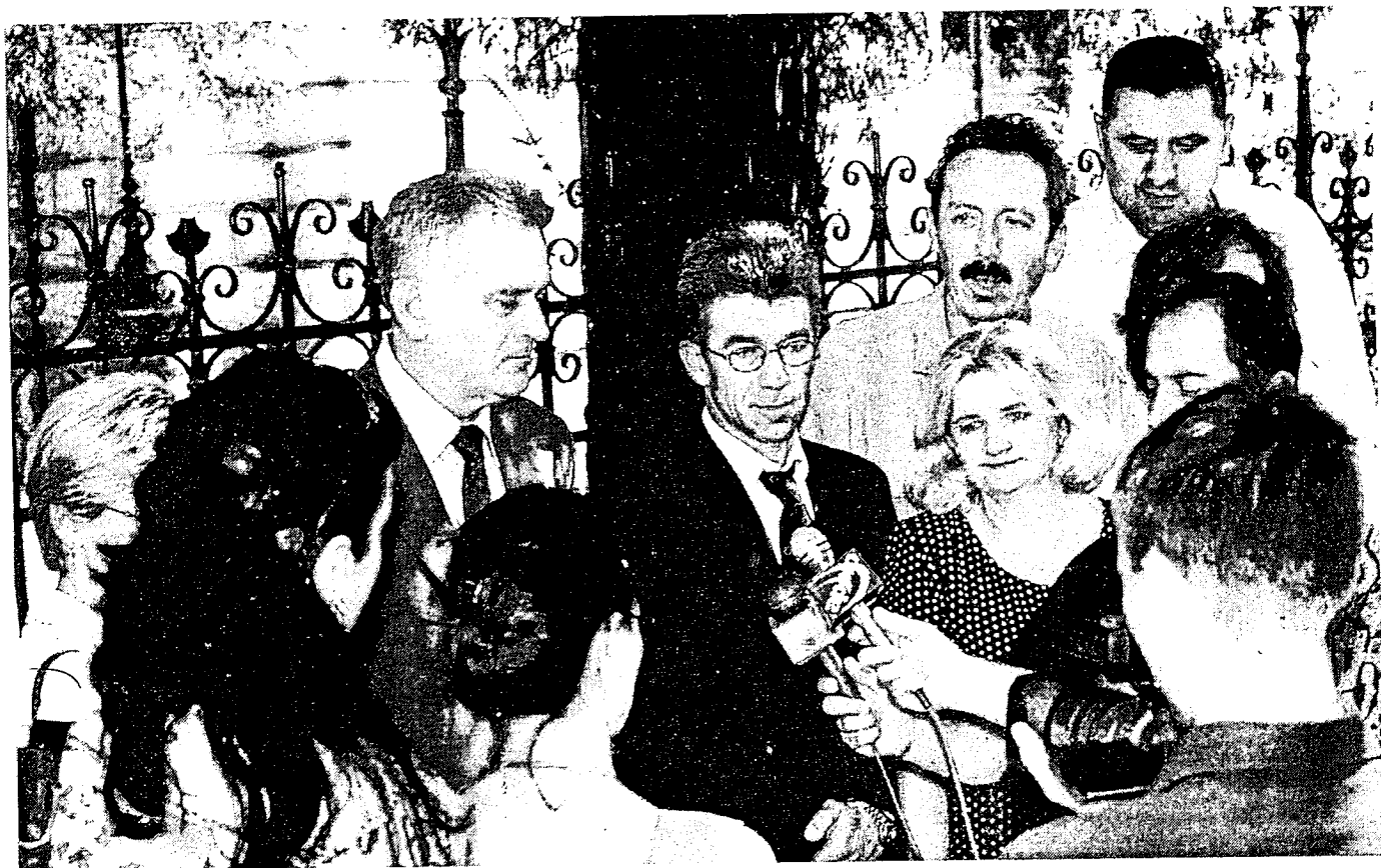
Заменик председника СРС Томислав Николић у посети Сремским Карловцима.

Поштовани грађани Ср. Карловаца, пред Вама је специјално издање наших новина којим желимо да Вас обавестимо о активности Српске радикалне странке у нашој Општини. Желимо да ове новине уђу у сваку кућу и да од Вас чујемо нове идеје, предлоге и иницијативе како да наш град буде боље место за живот свих нас. Учинимо заједно да наша средина осим традиционалних историјских и културних вредности буде препознатљива као град младости, поезије, толеранције и љубави.