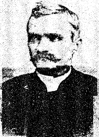
Димитрије Катић из Црквенца у Ресави, бив. председник Народне Скупштине

Димитрије Катић, економ из Црквенца (морав. окр.). Увек озбиљан, отмен, финих црта лица, укусно одевен — Катић је био ретка, јединствена појава у Народној Скупштини. Није било човека из народа у Скупштини који је тако падао у очи, као што је био Катић. Мудар човек, чист и светао карактер, одлучан и истрајан. Начином живота, држањем својим, Катић је служио свима за углед. Један од политичких противника његових назива га Српски Катон. Одиста, ниједном Србину не би то име тако пристајало као Катићу.