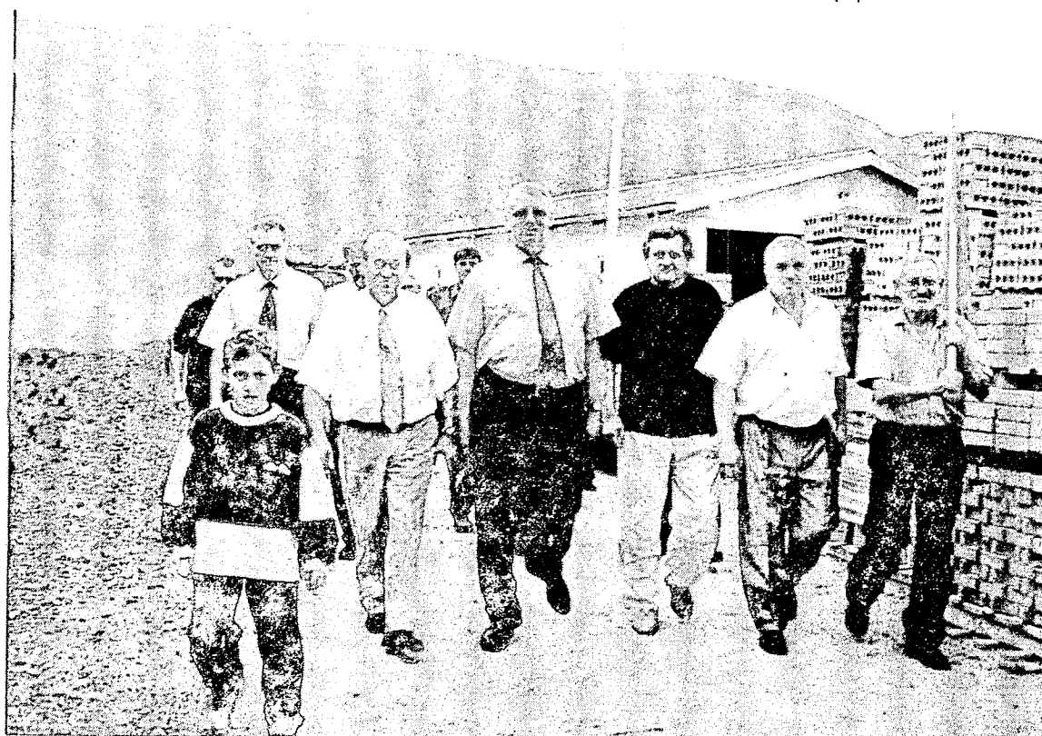
ДЕЛЕГАЦИЈА РАДИКАЛА У ПОСЕТИ БРУСКОЈ ПРИВРЕДИ