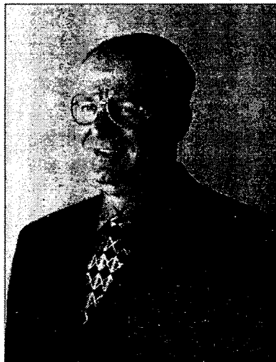
ШЕШЕЉ - СРПСКИ ЈУНАК

Пре две године Србија је испратила свог ратника у још једну битку. Испратили смо га са малом зебњом, али и са поносом. Српска радикална странка је данас поносна на Др Војислава Шешеља. Отишао је да се бори са Хашким трибуналом, монструозном творевином, која има циљ и задатак да суди само једном народу који се дрзнуо да брани свој опстанак, своја огњишта и своју слободу.