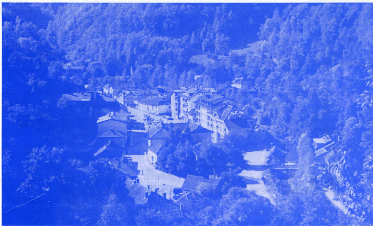
Панорама ЦРНЕ ТРАВЕ

Што значи да општина Црна Трава с таквим људима на челу не може зауставити миграцију становништва и није способна да целокупну општину стави на здраве ноге.