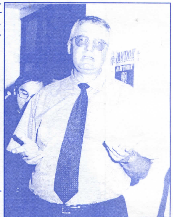
Др Војислав Шешелј ПРЕДСЕДНИК СРС Трговиште 2002 године.

Циљ уласка у власт је контрола и усмерење новчаних средстава тамо где су намењена и где су најпотребнија, а не профердати за репрезентације и преусмерити за задовољење политичких истомишљеника и профитера.