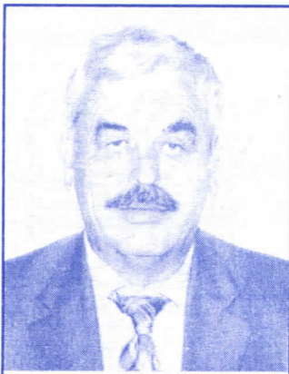
Драгослав Милковић НАРОДНИ ПОСЛАНИК СРС