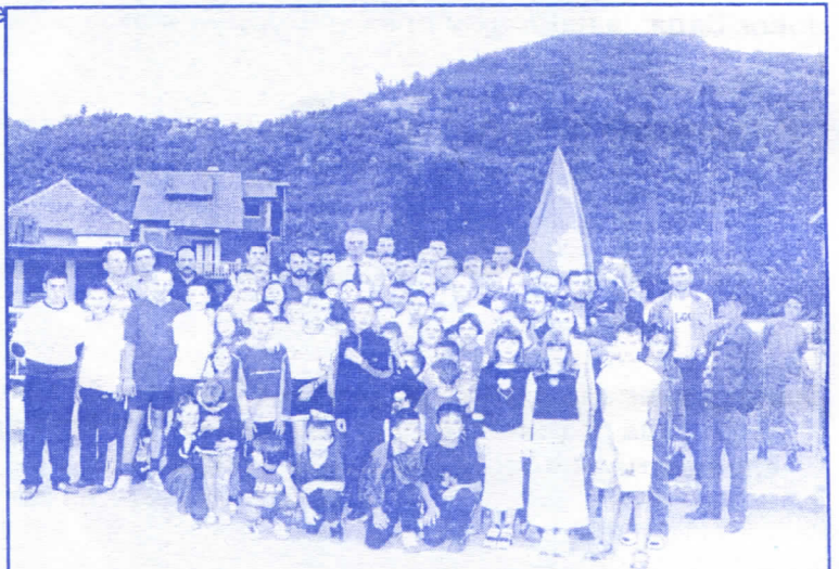
Др Војислав Шешел ПРЕДСЕДНИК СРС у посети Трговишту 2002. године

Оваква неефикасност и неспособност актуелне власти у земљи није запамћена па зато треба добро отворити очи када изађете на гласање и своји гласом подржати опцију која је на страни народа, а то смо ми, Српски радикали на челу са нашим председником др Војиславом Шешелџем.