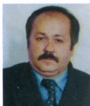
Јордан Кулунџић дир. Архива

Историјски архив Нови Пазар је једна од значајних институција, не само за Нови Пазар, Тутин и Сјеницу, већ и за Републику Србију.