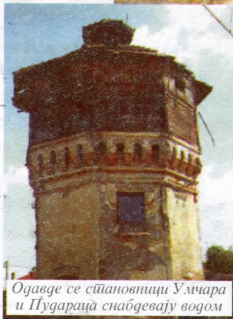
Одавде се становници Умчара и Пудараца снабдевају водом

грађана 50:50, као и побољшање уличне расвете у Центру.