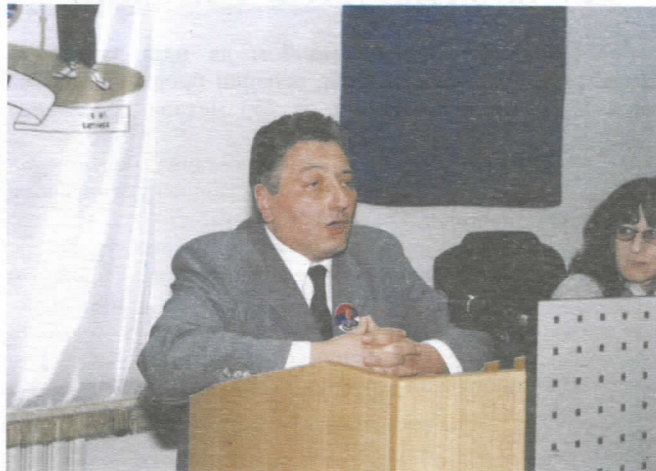
Један од дискусаната на скупштини Општинског одбора

гласањем утврђен на седници Општинског одбора као