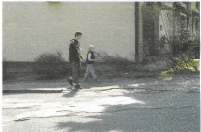
Деца су наше највеће богатство

По наводима станара горе наведених улица, просечно се деси 10-так ванредних догађаја годишње, на срећу, до сада само са материјалном штетом.