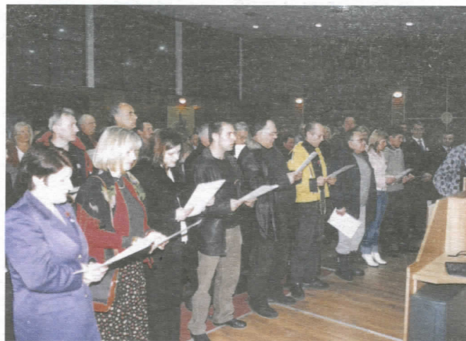
Нови чланови Општинског одбора полагају заклетву

јединствен предлог за годишњу Скупштину, чиме је Општински одбор кадровски ојачан.