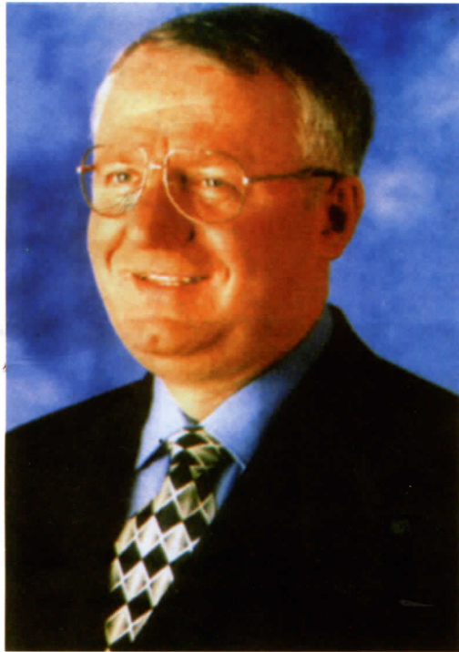
Проф. др. Војислав Шешелъ