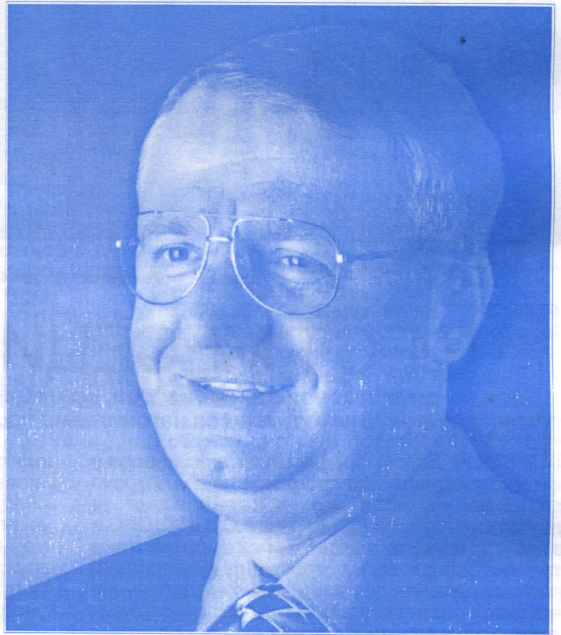
Српски јунак у Хашком казамату: др. Војислав Шешељ

Пре неколико дана из Хашког казамата су пуштени генерал Владимир Лазаревић, бивши министар одбране Драгољуб Ојданић, бивши председник Србије Милан Милутиновић и бивши потпредседник Савезне владе Никола Шаиновић.