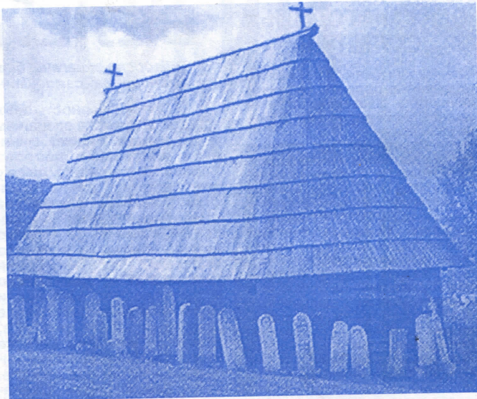
Културно наслеђе: Црква брвнара у Сечој реци

Један од великих проблема општине Косјерић је и градска депонија. Актуелна власт је у сарадњи са осталим општинама Златиборског округа близу решења и овог проблема. Наиме већ је разрађена стратегија изградње регионалне депоније, што