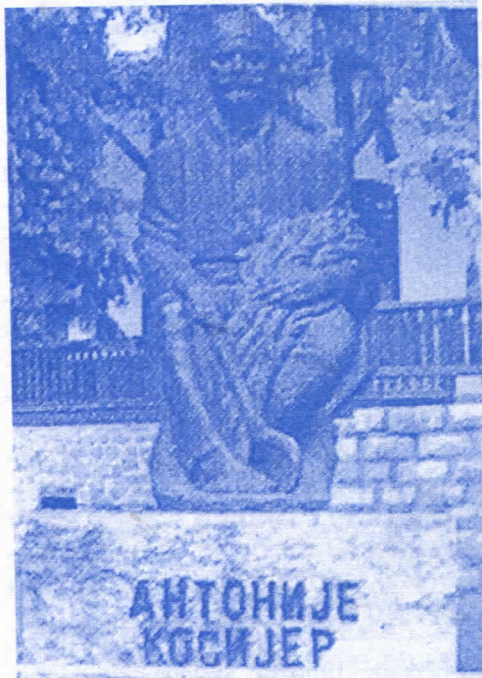
По њему је град добио име

Ово су само неки од проблема са којима се сусреће локална власт у Косјерићу. Српска радикална странка ће, својим поштеним и одговорним приступом, дати максимални допринос у њиховом решавању у интересу грађана Косјерића.