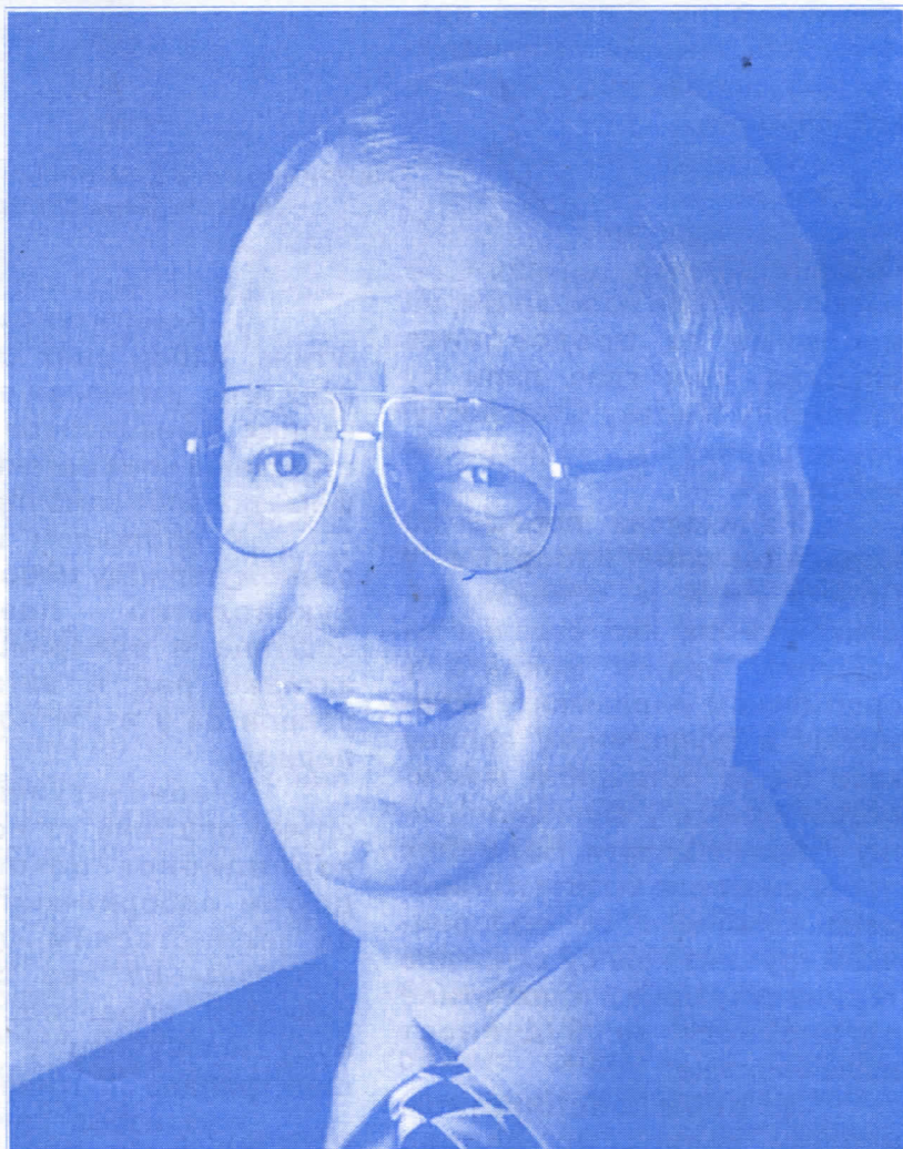
Српски јунак у Хашком казамату: др. Војислав Шешељ

Пре неколико дана из Хашког казамата су пуштени генерал Лазаревић, Ојданић, Милутиновић и Шаиновић. Иако је отишао добровољно, иако је Влада наводно дала гаранције и за његово ослобађање до почетка суђења др. Војислав Шешељ је и даље у Хагу.