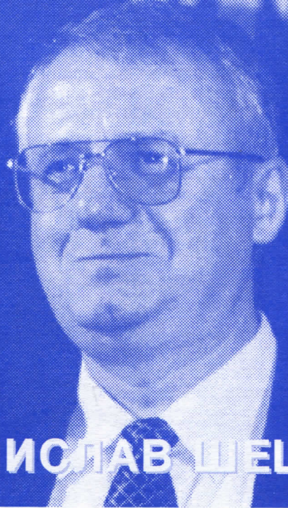
Др. ВОЈИСЛАВ ШЕШЕЉ

После две пуне године заточеништва у Хашком нацистичком затвору, заједно са осталим највећим јунацима данашње Србије, најхрабрији међу њима и поред силне тортуре која се спроводи над њим стоји усправно бранећи Српску државу и њену част, баш као што је обећао свима нама на одласку у ту велику битку са политичким моћницима тзв *ДЕМОКРАТСКОГ ЗАПАДА* . Доказ за сваку његову добијену битку у том рату су његова књижевна дела у којима раскринкава сву ту бајну демократију коју нам нуди запад а која има своје оличење и код нас под именом најпре ДОС(манлије) а данас без маске *ДЕМОКРАТСКА СТРАНКА* (запада) која је главни текстописац хашке оптужнице против ДрВојислава Шешеља.