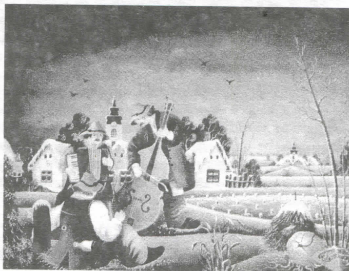
ово је права уметност мештана

"остаћете без посла". Можда је тако требало, можда је то њихова Европа за коју се свакодневно закљичу. По обављеној приватизацији Шећеране, видно је да о свему општи луд са збуњеним. Из свега овога може се извући поука. Не требају овом народу спасиоци попут НАТО-а, Вука Драшковића и припадника Г-17. Сви они ставили су се на услугу најгорем непријатељу нашег народа.