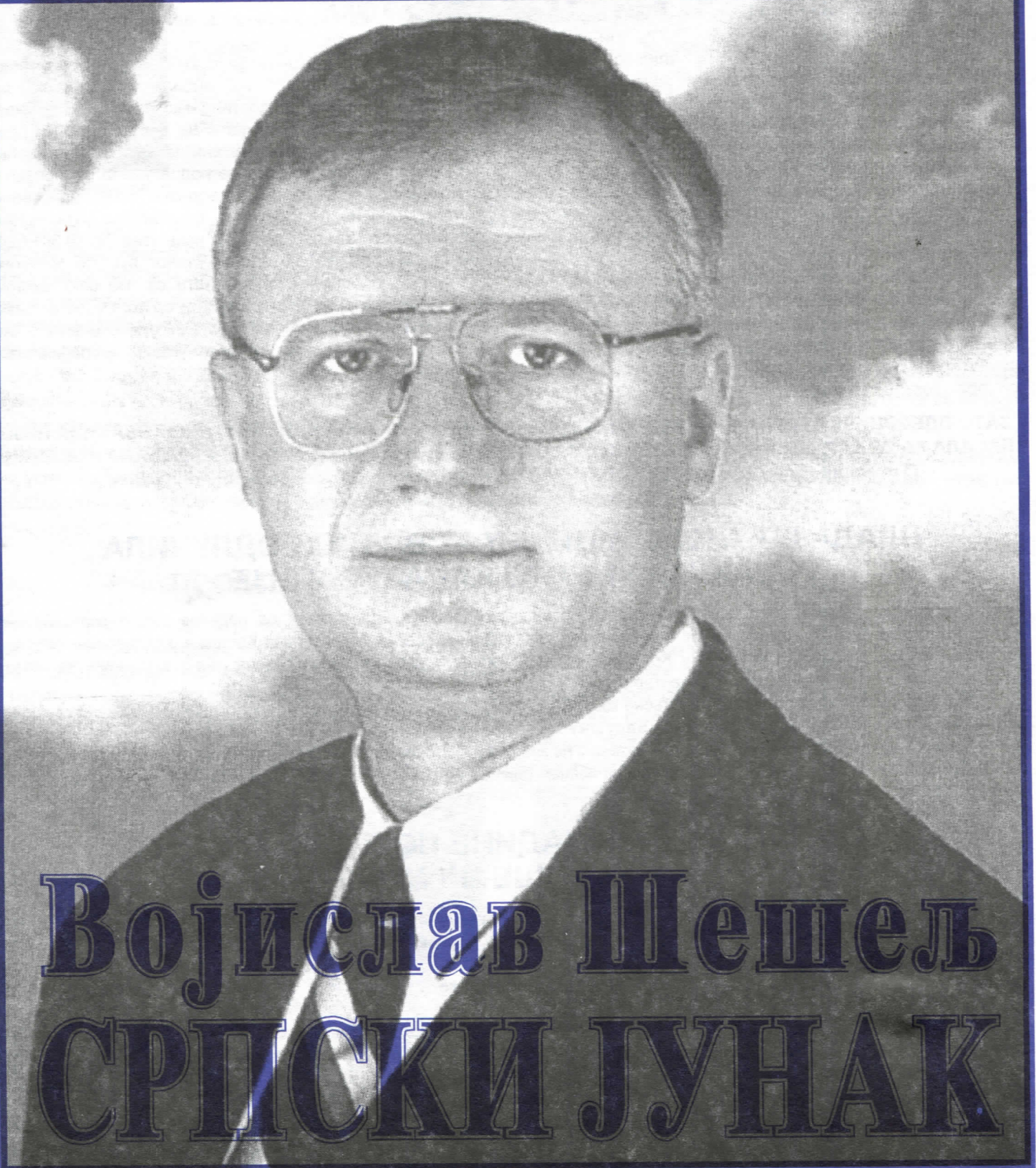
Војислав Шешелъ СРПСКИ ЈУНАК