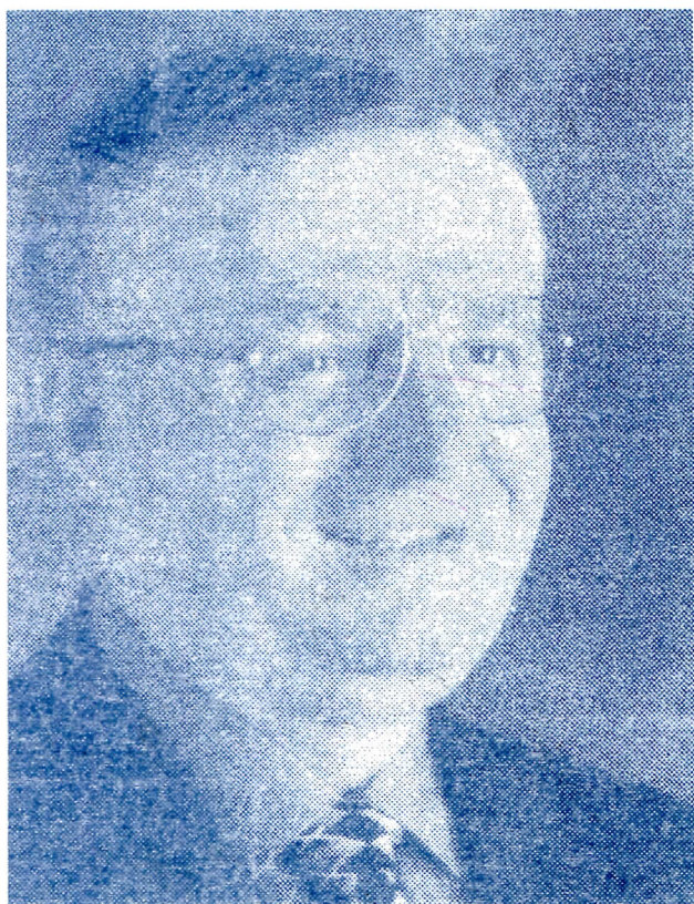
ДР ВОЈИСЛАВ ШЕШЕЉ ПОБЕДИЉУ ХАНЌИ ТРИБУНАЛ

СТАРА ПАЗОВА, АПРИЛ 2005. ГОДИНЕ ГОДИНА XVI, БРОЈ 2003