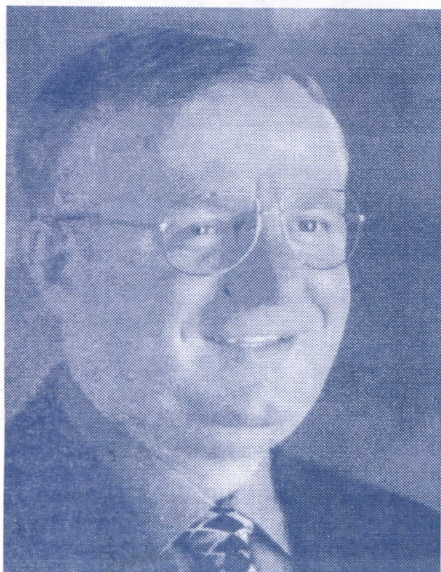
ДР. ВОЈИСЛАВ ШЕШЕЉ ПОБЕДИЉУ ХАШКИ ТРИБУНАЛ

БЕЛЕГИШ, АПРИЛ 2005. ГОДИНЕ ГОДИНА XVI, БРОЈ 1989