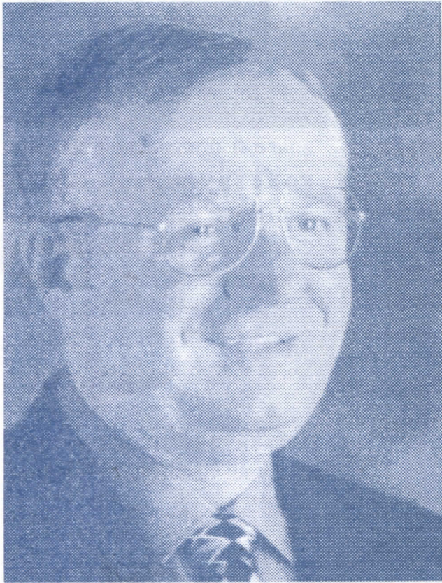
ДР. ВОЈИСЛАВ ШЕШЕЉ ПОБЕДНИКУ ХАШКИ ТРИБУНАЛ

ГОЛУБИНЦИ, АПРИЛ 2005. ГОДИНЕ ГОДИНА XVI, БРОЈ 1988