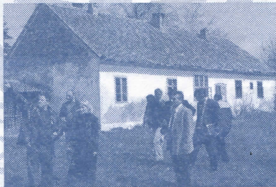
Простор за будуће школско двориште

Најизраженији проблем основне школе 23 Октобар је решавање питање школског дворишта и објеката за извођење наставе физичког образовања. У сарадњи са Општином Стара Пазова, откупом куће у Шимановачкој улици овај проблем биће решен. Изградњом школског дворишта са свим пратећим садржајима потребним за одвијање наставе решио би се овај дугогодишњи проблем ученика ове школе. Решењем овог проблема постигла би се безбедност деце.