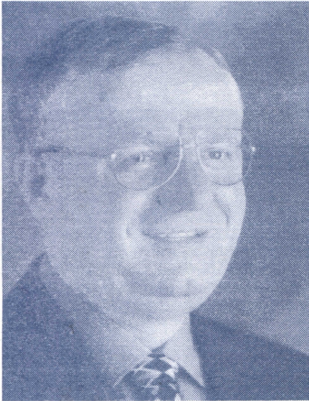
ДР. ВОЈИСЛАВ ШЕШЕЉ ПОБЕДНИЉУ ХАНСКИ ТРИБУНАЛ

ВОЈКА, АПРИЛ 2005. ГОДИНЕ ГОДИНА XVI, БРОЈ 1987