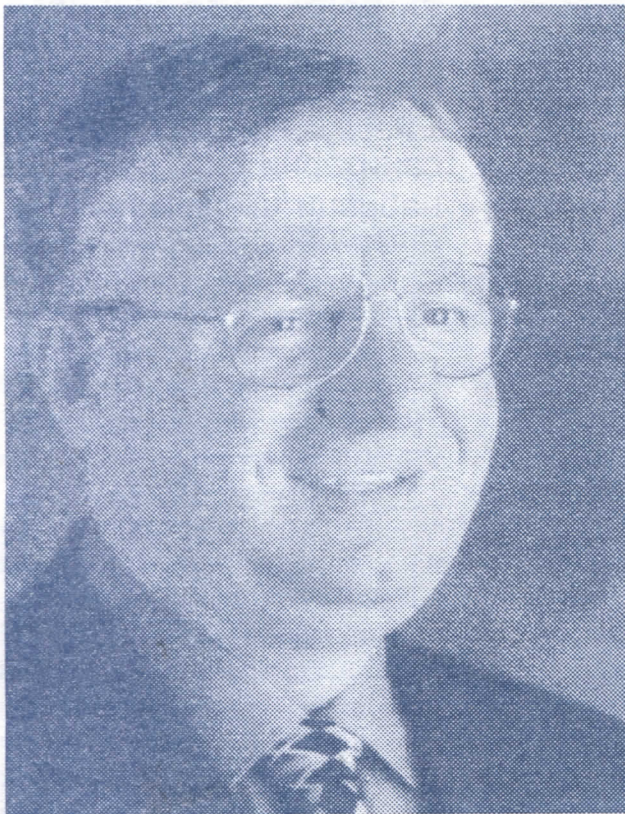
ДР. ВОЈИСЛАВ ШЕШЕЉ ПОБЕДИЉУ ХАШКИ ТРИБУНАЛ

СТАРИ БАНОВЦИ, АПРИЛ 2005. ГОДИНЕ ГОДИНА XVI, БРОЈ 1985