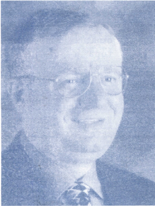
ДР. ВОЈИСЛАВ ШЕШЕЉ ПОБЕДИЋУ ХАШКИ ТРИБУНАЛ

СТАРА ПАЗОВА, АПРИЛ 2005. ГОДИНЕ ГОДИНА XVI, БРОЈ 1983