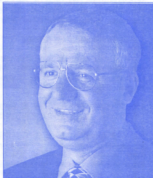
Др Војислав Шешељ

ПРЕДСЕДНИК СРПСКЕ РАДИКАЛНЕ СТРАНКЕ Др Војислав Шешељ