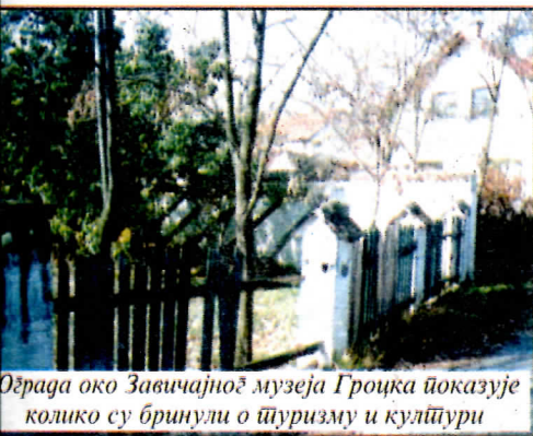
Ограда око Звездајног музеја Гроцка показује колико су бринули о туризму и култури

авио ми њега, да је дао лажне податке, али знамо да се према каси у комуналном предузећу понаша као према својој приватној, из које узима колико год хоће, па се плашимо да нам тужбу неће усвојити. Још једну тужбу би смо