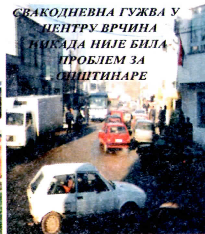
СВАКОДНЕВНА ГУЖВА У ЦЕНТРУ ВРЧИНА НИКАДА НИЈЕ БИЛА ПРОБЛЕМ ЗА ОПШТИНАРЕ