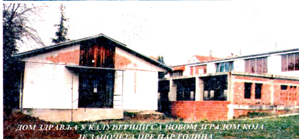
ДОМ ЗДРАВЉА У КАЛУЂЕРИЦИ СА НОВОМ ЗГРАДОМ КОЈА ЈЕ ЗАПОЧЕТА ПРЕ ПАР ГОДИНА

ОПРЕМА ЗА ПРЕЧИШЋАВАЊЕ ВОДЕ У УМЧАРИМА КОЈА ТРУНЕ ВЕЋ ДВЕ ГОДИНЕ ДОК СТАНОВНИЦИ ПИЈУ ЗАГАЂЕНУ ВОДУ