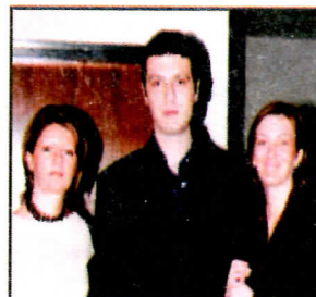
Председник изборне комисије са кабинетом председника. Дали ће избори проћи без крађе?