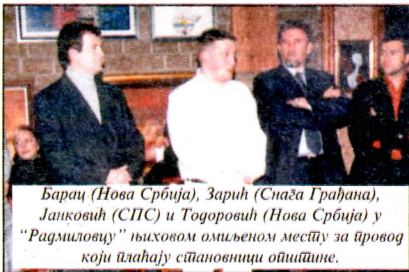
Барац (Нова Србија), Зарић (Снага Грађана), Јанковић (СПС) и Тодоровић (Нова Србија) у "Радмиловицу" њиховом омиљеном месту за провод који плаћају ситановници општине.

- Народ мора да зна шта му се спрема. Морамо народу рећи да је ово покушај да људи који су до сада