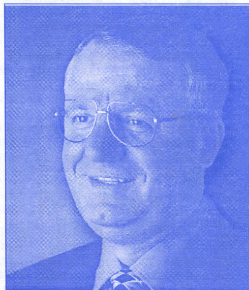
Др Војислав Шешељ

ПРЕДСЕДНИК СРПСКЕ РАДИКАЛНЕ СТРАНКЕ Др Војислав Шешељ