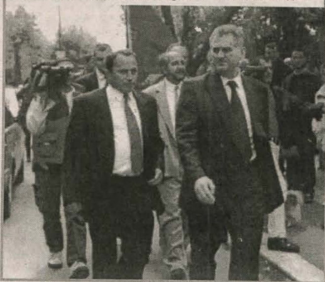
Косовска Митровица: изборна кампања 2000. године

ба живи у такозваним енклавама у којима су убиства и иживљавања над српским становништвом готово свакодневна. Живот у енклавама подсећа на затворски живот. Живот се одвија у кућама, а напоље се излази тек по намирнице, али и то на велики ризик. Комуникација са њима је отежана, готово никаква. Уколико неко жели да их посети или одатле оде негде другде, мора да прође кроз територије које су под контролом шиптарских терориста. „Терористи сваки дан чине злодела. Међутим, о томе светска јавност није, нити жели да буде обавештена”, истиче Краговић, и додаје да су по доласку КФОР-а за одлазак у та ризична места биле организоване разне пратње и конвоји, међутим, пратње су укинуте,