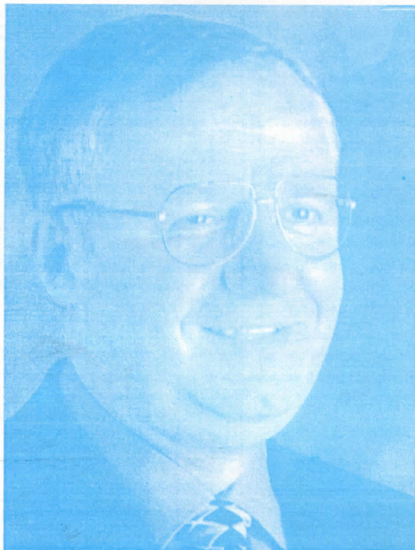
ДР. ВОЈИСЛАВ ШЕШЕЉ