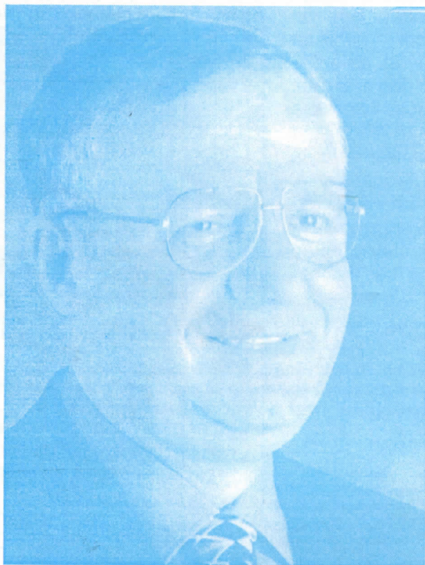
ДР. ВОЈИСЛАВ ШЕШЕЉ