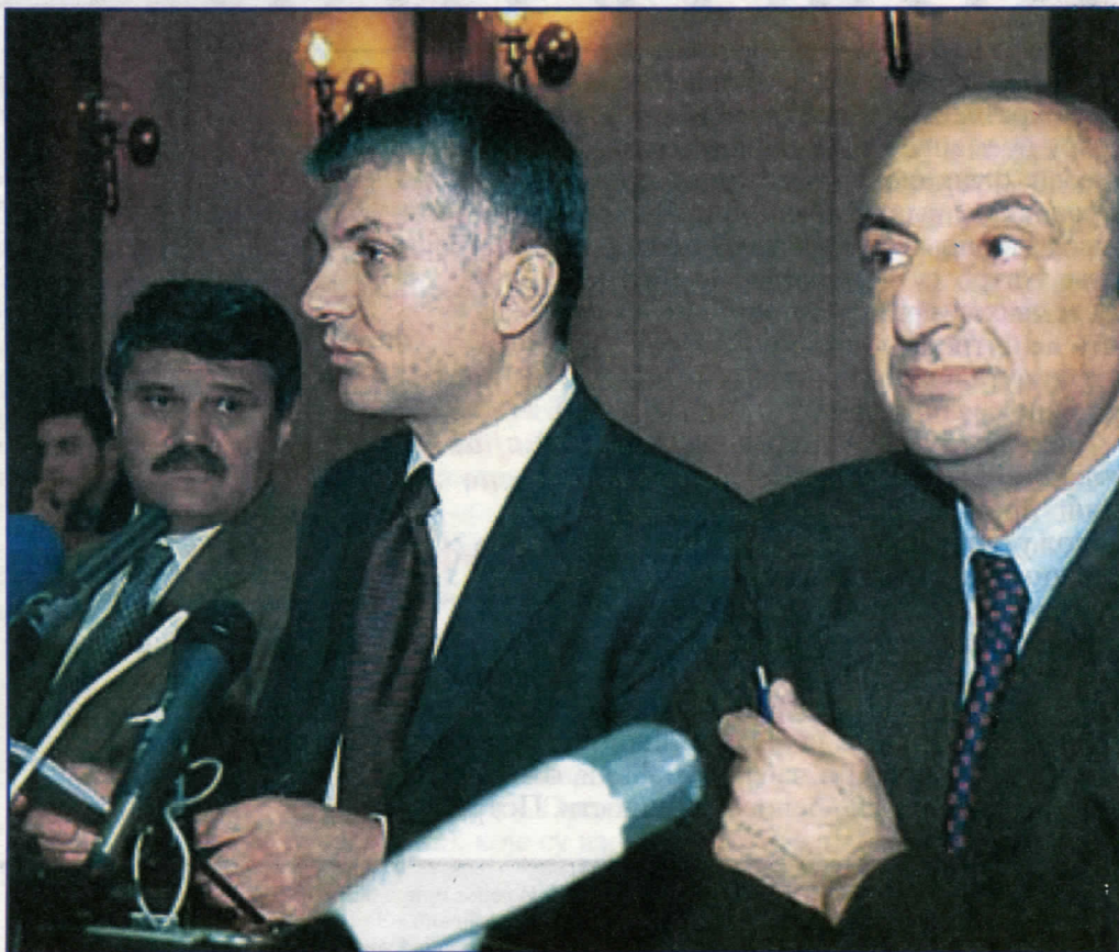
Досовска „грозница” напада сваки витални део, још живог државног организма