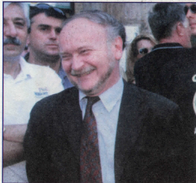
Један од потпредседника Републичке владе залаже се за склапање хомосексуалних бракова, да ли су грађани за то гласали